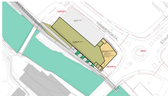
Figur 3 Situasjonsplan for den nye varmesentralen i Hammerdalen, Hammerdalen II.

Den nye energisentralen er planlagt vegg i vegg med eksisterende sentral, og koblet til denne. I samsvar med gjeldende reguleringsplan legges det til rette for bygging av bolig/næring over energisentralen. HF oppgir at sentralen ikke skal være til hinder for etablering av en gangpassasje under dagens bru for fv. 301 over Farriselva. Følgende figur viser varmesentralen i omsøkt situasjonsplan.