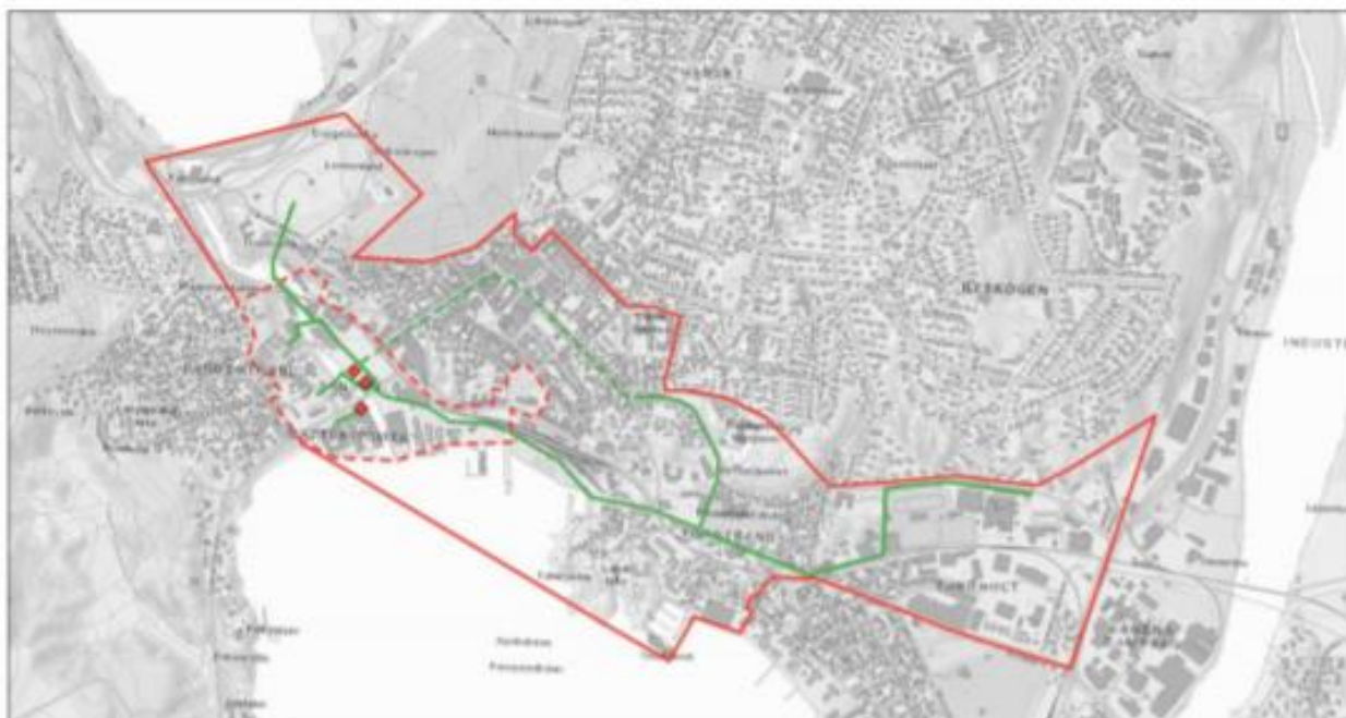
Figur 1 – Konsesjonsgitt utvidelse av konsesjonsområde for fjernvarme.

Norges vassdrags- og energidirektorat (NVE) har i dag gitt Hammerdalen Fjernvarme AS (HF) revidert konsesjon for deres fjernvarmeanlegg i Larvik kommune, Vestfold og Telemark fylke. Tillatelsen gir HF rett til å levere fjernvarme til Larvik sentrum. HF skal også levere kjøling. Området det nå er gitt konsesjon for er vist på kart under, med det eksisterende konsesjonsområdet vist med stiplet strek. For større kart, se NVEs nettsted for saken.