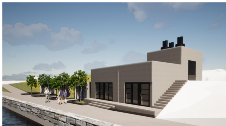
Figur 4 Illustrasjon av den nye varmesentralen i Hammerdalen, Hammerdalen II.

Den omsøkte nye varmesentralens utforming er vist med plan- snitt og fasadeteningering i vedlegg til søknaden. Den synlige delen av bygget vil bli oppført i Leca med overflate på samme måte som dagens energisentral. Anleggets visuelle virkninger er illustrert på følgende tegning.